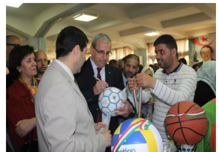
Dédicace du Recteur d'un ballon de foot

Wali d'Oran les autorités locales et les chefs d'établissements universitaires de la ville d'Oran qui ont ensuite assisté à la remise de prix pour les équipes vainqueurs des différents tournois.