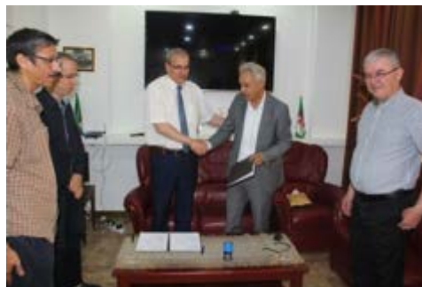
Mr le recteur avec le directeur « Alfatron Electronic Industries »

Cette Convention porte sur la collaboration avec le laboratoire de recherche LITIO pour le montage d'unités de calcul intensif (UCI) en intégrant du matériel de cette entreprise, avec une suite logicielle HPC adéquate.