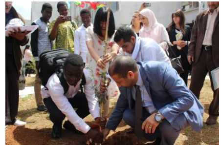
Vice-recteur de la pédagogie, la lectrice chinoise et un étudiant plantent un arbre comme symbole de la paix

A l'occasion de la journée nationale du vivre ensemble en Paix, célébrée le 16 Mai de chaque année, l'Université d'Oran 1 Ahmed Ben Bella à fêté cette journée en conviant l'ensemble de la communauté des étudiants étrangers a une conférence « Effets de la Paix sur les relations internationales » et ensuite à la plantation d'un olivier dans le campus Mourad Taleb (Ex. IGMO) symbole la paix. L'objet de cette célébration est de diffuser l'esprit de tolérance et la culture de la paix.