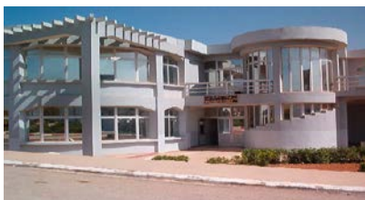
Bibliothèque des Sciences